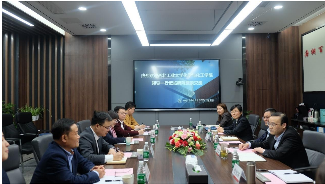
图 1. 会议现场